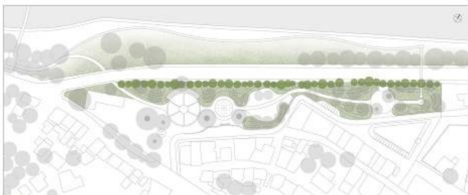
● υψηλή θαμνώδης φύτευση

Οι χαμηλοί θάμνοι μειώνουν/αποκλιμακώνουν τη φύτευση και καδράρουν τη θέα προς το βουνά.