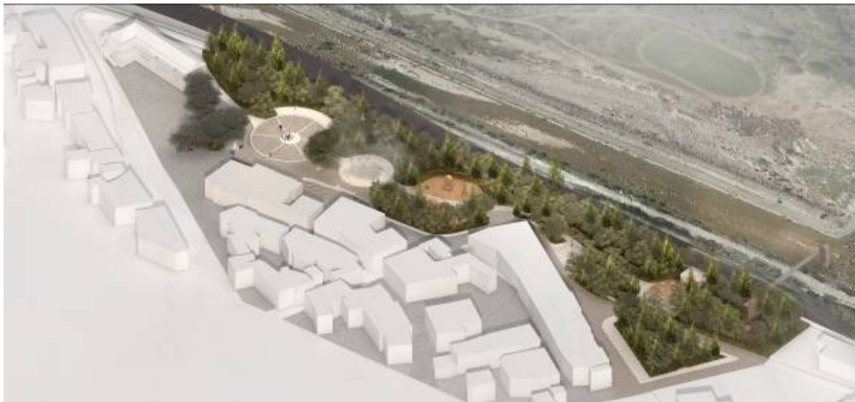
Η νέα διαμόρφωση της πλατείας δημαρχείου

Η κεντρική ιδέα της πρότασης βασίζεται στην συνθετική έννοια της «κοιλάδας». Το έδαφος αποκτά εξάρσεις, η επίπεδη επιφάνεια μετατρέπεται σε λόφους. Στο κοίλο τμήμα μια διαδρομή περιπάτου, μία γραμμική ροή που τέμνει την επιφάνεια, είναι η κοίτη του «ποταμού». Η σύγκλιση των λόφων γίνεται η συνάθροιση των ανθρώπων.