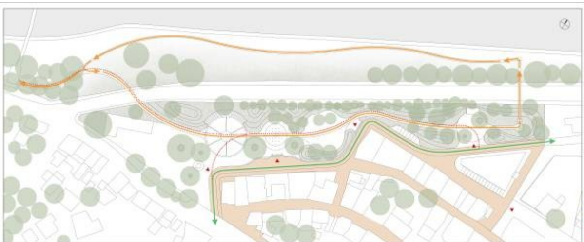
Διάγραμμα κινήσεων - Διαδρομές περιπάτου και πεζόδρομοι

Η κεντρική διαδρομή-περίπατος διασχίζει όλες τις δραστηριότητες και δημιουργεί μία κυκλική πορεία συνδέοντας την πλατεία με την πεζογέφυρα και την παραποτάμια περιοχή. Ξεκινάει από το πιο αστικό κομμάτι που συνδέεται άμεσα με το Δημαρχείο οδηγώντας είτε κάτω από την εθνική οδό προς την κρεμαστή γέφυρα της Πύλης είτε στο ανατολικό άκρο της περιοχής μελέτης σε μία πιο φυσική-δασική διαμόρφωση με υψηλή δενδρώδη φύτευση. Προτείνεται στο σημείο αυτό η σύνδεση με την παραποτάμια περιοχή του Πορταϊκού μέσω μίας πεζογέφυρας-παρατηρητηρίου πάνω από την εθνική οδό ώστε να παραμείνει η σύνδεσή του με τον οικισμό και να δίνεται η δυνατότητα στον επισκέπτη να διεξάγει μια κυκλική διαδρομή από την περιοχή ανάπλασης προς τις ζώνες ιδιαίτερου φυσικού κάλους που βρίσκονται παραπλεύρως του ποταμού.