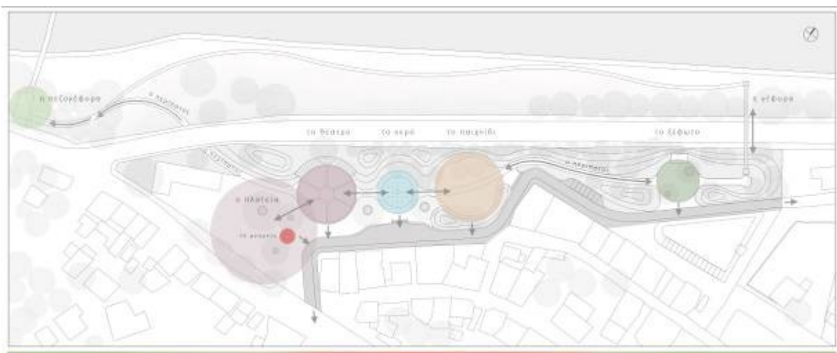
Διάγραμμα χρήσεων - Σημεία ενδιαφέροντος και χώροι δραστηριοτήτων

Οι υπαίθριοι χώροι δραστηριοτήτων εκπληρώνουν τις ανάγκες του οικισμού και ενοποιούνται με τον αστικό ιστό μέσω της πεζοδρόμησης της οδού Ηρώων 1940 και των πέριξ δημοτικών οδών. Αναλυτικά προτείνεται να παραμείνει ο χώρος του μαρμάρινου αμφιθεάτρου και να ενταχθεί πλήρως στο φυσικό τοπίο, καθώς και η σύνδεσή του με τον υπαίθριο χώρο του Δημαρχείου και την επέκταση του πεζόδρομου της Ερμού έτσι ώστε να δημιουργηθεί ένας μεγάλος, κατάλληλος για τις ανάγκες του οικισμού, ευρύς χώρος εκδηλώσεων. Στο χώρο της ευρείας πλατείας που δημιουργείται τοποθετείται το μνημείο της Εθνικής αντίστασης ορίζοντας και την είσοδο στη νέα αστική ανάπλαση. Στην ανατολική πλευρά του ΟΤ62 προτείνεται η τοποθέτηση της παιδικής χαράς, σε σκιερή και προστατευμένη από τα πρανή διαμόρφωση. Ο χώρος του παιχνιδιού συνδέεται μέσω της διαδρομής περιπάτου με το στοιχείο του νερού, μία κυκλική διαμόρφωση με πίδακες νερού για παιχνίδι των παιδιών και σε άμεση οπτική επαφή με το χώρο των εκδηλώσεων αλλά και την οδό ήπιας κυκλοφορίας της οδού Ηρώων 1940. Προχωρώντας ανατολικά, προς το ΟΤ63 δημιουργείται το «δάσος», το πιο φυσικό κομμάτι της συνολικής ανάπλασης με υψηλή δενδρώδη φύτευση, στο εσωτερικό του οποίου δημιουργείται ένα «ξέφωτο» για ξεκούραση και αναψυχή με ένα μικρό αναψυκτήριο και την πρόσβαση προς τη νέα πεζογέφυρα και το παρατηρητήριο.